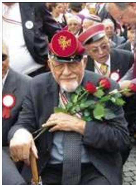
bw Viel Blumen am Festumzug...