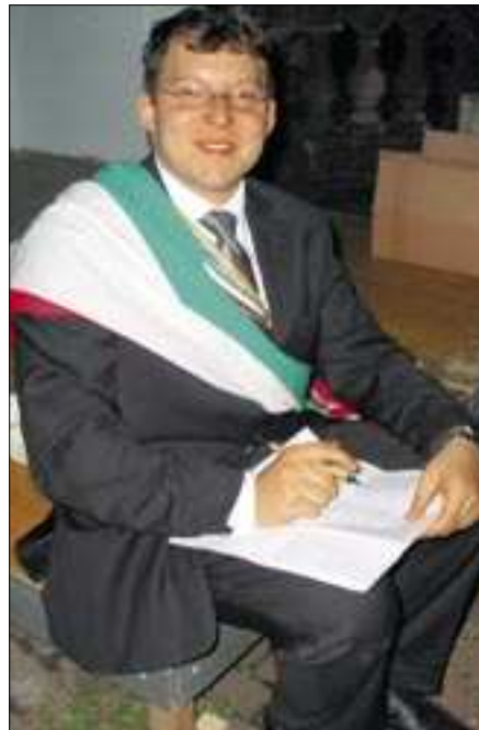
CA Gin durchkammert die Kandidatenliste.