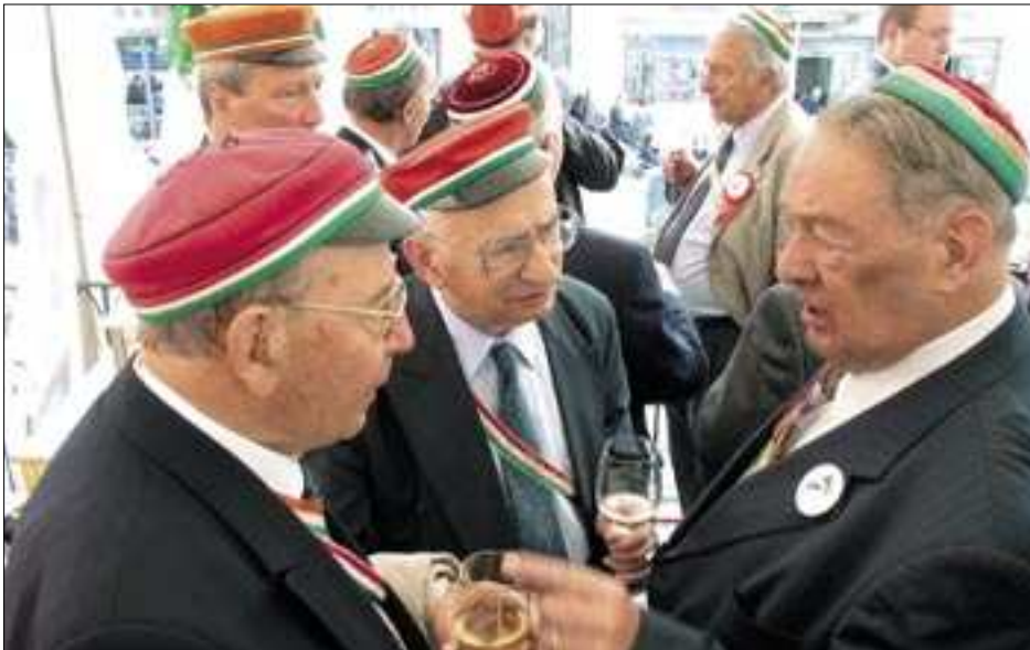
Das berühmte alt CP-Apero nach der Messe.