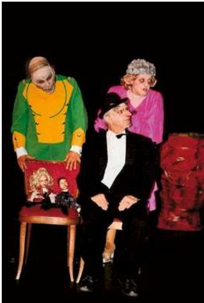
La panne, de Friedrich Durrenmatt.

Reflexions sur le theatre amateur en Suisse romande