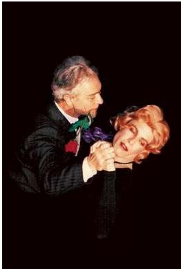
Certains l'aiment chaud.

Le théâtre amateur est une manifestation sociale et populaire majeure. On estime à plus d'un million le nombre de ses spectateurs annuels sur l'ensemble de la Suisse. Et pourtant il est bien mal connu. Certes, chacun a été confronté une fois ou l'autre à un spectacle de fin d'année ou donné par des familiers et s'est fait sa petite idée. Mais le théâtre amateur proprement dit est caractérisé, en Suisse, par une organisation dans la durée de ses activités et son attachement au principe associatif. Présent aussi bien dans les villages que dans les villes, il est organisé et diversifié. Quatre fédérations, une par région linguistique, accueillent quelque 900 troupes permanentes et donnent à certaines troupes accès à des festivals nationaux et internationaux.