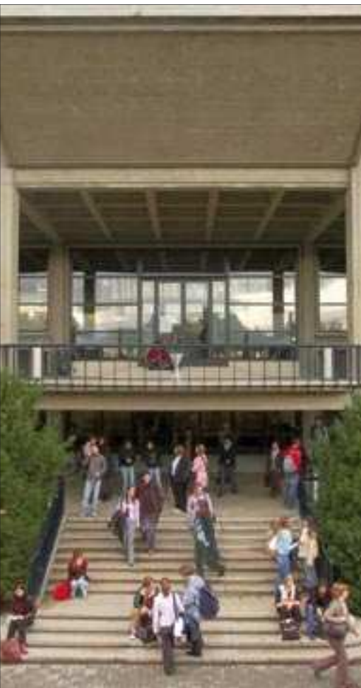
4000 étudiants en lettres à Fribourg.